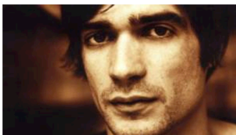
Spring Attitude Festival – Jon Hopkins

Spring Attitude 2017 è come il suo simbolo, realizzato ad hoc dallo Studio Lord Z di Roma: “An adventure into the mysterious and psychedelic world of the Still Life”, un viaggio tra forme non svelate provenienti da ogni parte del globo, in apparente contrapposizione ma in effettiva integrazione e ispirazione. Tre giorni dedicati all’esplorazione culturale e creativa, tra nuove realtà e i più solidi protagonisti del panorama internazionale, per una raffinata esperienza artistica e multimediale che da sempre connota il festival.