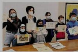
I sei ideatori del progetto