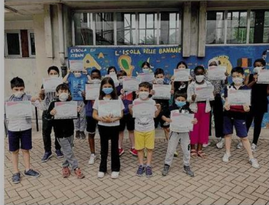
I ragazzi della scuola media Sassi con l'attestato