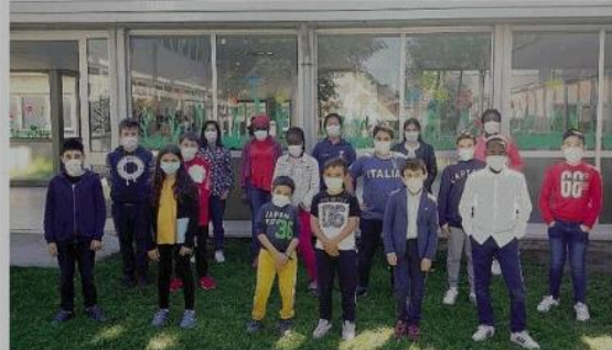
Il concorso mira a premiare l'istruzione di qualità