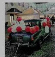
L'auto di Babbo Natale