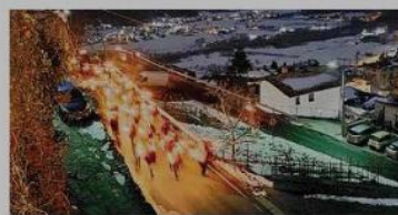
La fiaccolata lungo le vie di Poggiridenti